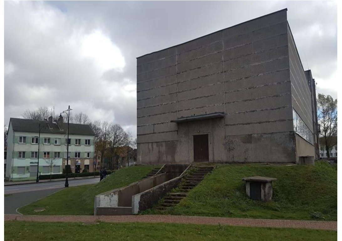
Sporto salė Pilies g. 2A (vadovaujantis teritorijų planavimo dokumentas turi būti nugriauta)