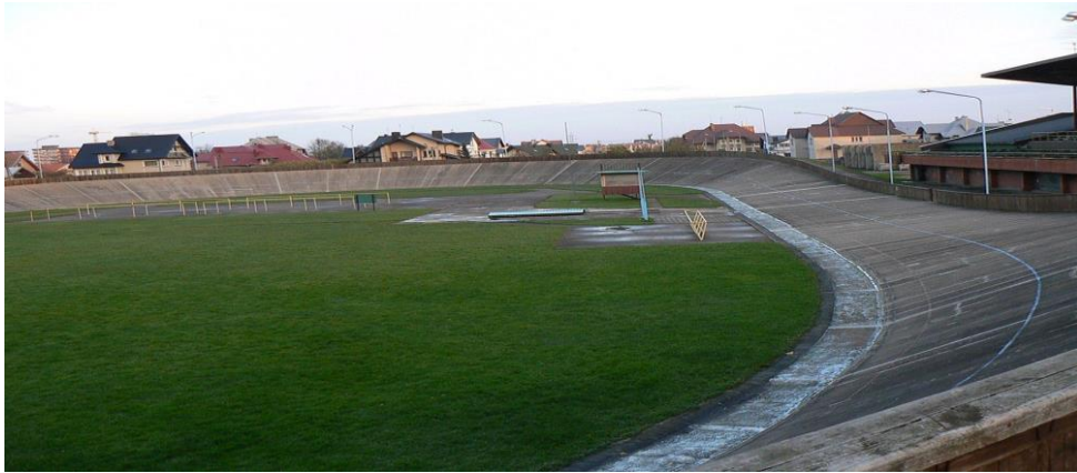
Dviračių trekas Kretingos g. 38