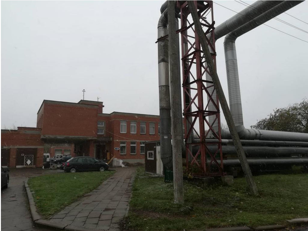
Irklavimo sporto bazė Gluosnių skg. 8